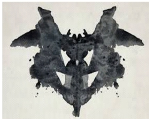
चित्र 2.1 रोशा स्याही धब्बा परीक्षण में प्रयुक्त एक कार्ड

यह परीक्षण हर्मन रोशा द्वारा विकसित किया गया। इसमें दस स्याही धब्बे जैसे चित्र वाले 10 कार्ड होते हैं। (देखें चित्र 2.1) प्रत्येक स्याही धब्बा 7 x 10 के आकार के कार्ड के ठीक बीच में मुद्रित होता है। प्रयोज्य इन स्याही धब्बों को देखकर यह बताता है कि वह इस कार्ड में क्या देखता है। प्रयोज्य की इन अनुक्रियाओं की व्याख्या/अंकन के लिये एक विस्तृत पद्धति भी तैयार की गई है। इस परीक्षण के उपयोग एवं परिणामों की व्याख्या के लिये कुशल प्रशिक्षण की आवश्यकता होती है।