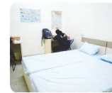
सेपरेट हॉस्टल (Boys / Girls)