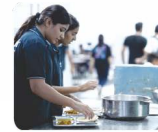
गुणवत्तापूर्ण पौष्टिक भोजन