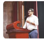
विषय विशेषज्ञों द्वारा मार्गदर्शन