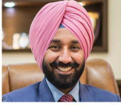
सतनाम सिंह संधु

राष्ट्रपति द्वारा राज्यसभा के लिए मनोनीत।