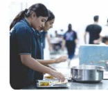
गुणवत्तापूर्ण पौष्टिक भोजन