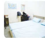
सेपरेट हॉस्टल (Boys / Girls)